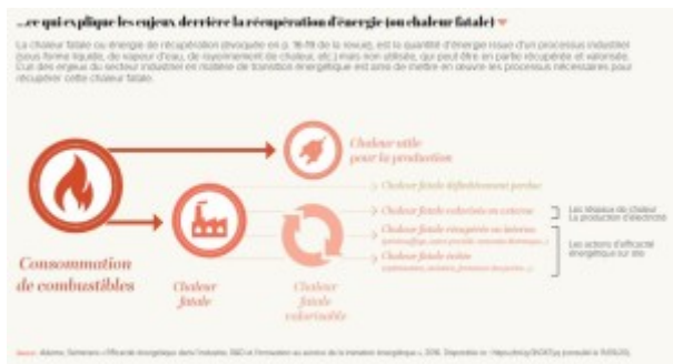
...ce qui explique les enjeux derrière la récupération d'énergie (ou chaleur fatale)