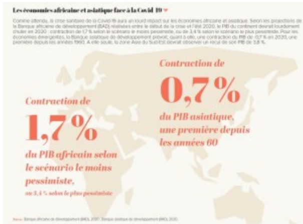
Les économies africaine et asiatique face à la Covid-19